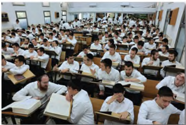
פתיחת זמן אלול בישיבת 'רנה של תורה'