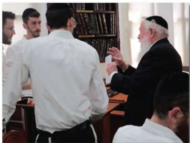
'המרא דאתרא בכולל המרכזי 'כרם מיכאל'.

כדאי לציין את תנופת הפיתוח הבלתי פוסקת של העיר, שבאה לידי ביטוי בתחומים רבים, כמו בנייתם של בתי כנסת ומבנים חדשים ומפוארים למוסדות הלימוד, מה גם שכל הדירות המוצעות כיום הינם יד שנייה,