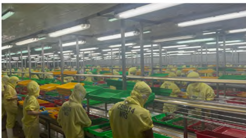
פילוס הדגים בהלגיה 3/14

הרב צרפתי מדגיש, כי האישור ניתן לאחרונה, רק בתנאי שהטונה מגיעה למפעל באחת משני האפשרויות הבאות, בהם אין את החששות הנ"ל: