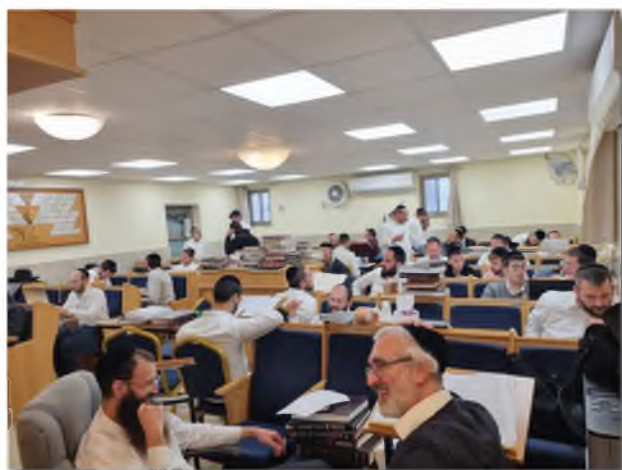
בישוב הדעת - בתי המדרש השוקקים פרוסים ברחבי העיר. בתמונה: כולל 'אהלי תורה' בשכונת גבעת רם