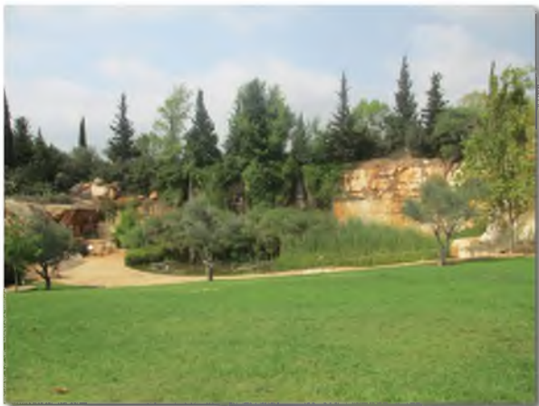
פארקים ושטחים ירוקים לרוב