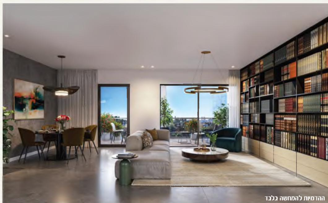
ההדמיות להמחשה בלבד

פרויקט חברותא מברך אתכם בברכת מועדים לשמחה ומזמינכם להכיר את שכונת המגורים החדשה של אופקים, שתוכננה מהיסוד לקהילת בני תורה, שכונה של משפחות שחושבות יחד, מתקדמות יחד, ומגדלות דור של תורה באווירה תומכת, קהילתית ובטוחה. בחברותא הבית שלך הוא חלק ממשוה גדול באמת, מול מרחבים ירוקים, בצמוד לפארק רחב ידיים. בואו לחיות בקהילה של אכפתיות, שכנות, מניינים, שיעורים ויחד אמיתי. לבחירתכם: דירות 5 חד', דירות גן ופנטהאוזים.