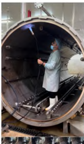
בהצלחת התנור הלבן צ"י איבון

כשאנו מדברים על הקשיים בהענקת כשרות לדג טונה בשימורים, האתגר היה בעיקר בשיטת הדיג הנפוצה, בה אניית התובלה מפליגה לעומק הים לתקופה ארוכה, ומלאכת הדיג מתבצעת משך כל תקופת ההפלגה. כשהדייגים מזהים להקה של טונה, הם משליכים לים את החכה או הרשת (תלוי בשיטות הדיג השונות), ומכאן שורש הבעיה. ברשת, לא ניתן למנוע מדגים אחרים לעלות יחד עם דגי הטונה וביניהם גם דגים טמאים, וממילא כל הדגים הניצודים נכנסים לרשת בערבוביה. בחכה, מאחר ובדרך כלל משתמשים בחוט ארוך המכיל קרסים רבים בהפרשי מרחק ניכרים עליהם נתפסים הדגים, ומשכך אין שליטה מספקת על זהות הדגים הניצודים.