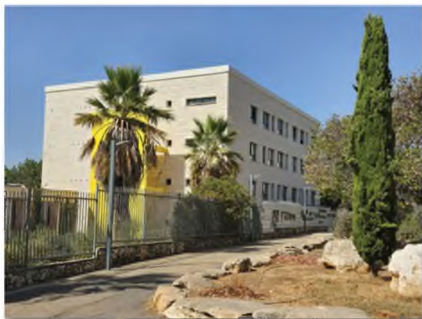
בהשקעה של 14 מיליון ₪ - קמפוס רחב ידיים המסתיים בימים אלו לטובת החיידר לילדי כרמיאל

כך כאשר אתה קונה דירה הינך יכול להכנס מיידית לדירה ובכך נחסכים עשרות אלפי שקלים של שכר דירה והמתנה עד להשלמת הבנייה. בנוסף, בשנים הקרובות אמורות להבנות אלפי יחידות דיור חדשות, דבר שיאפשר בעתיד לאברכים לשפר דיור מבלי לעזוב את העיר ומוסדות החינוך.